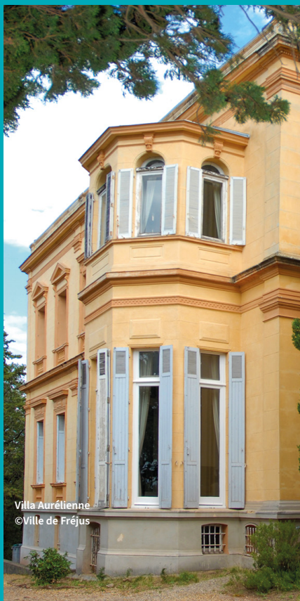
Villa Aurélienne

Visites groupes et en langues étrangères : renseignements et réservations auprès de l'Office de Tourisme.