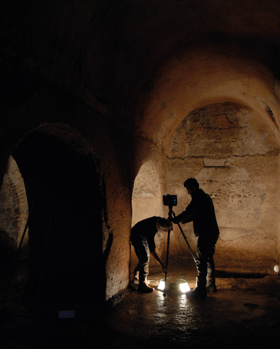
Relevés photogrammétriques 3D de la citerne Site archéologique de la Plate-Forme romaine