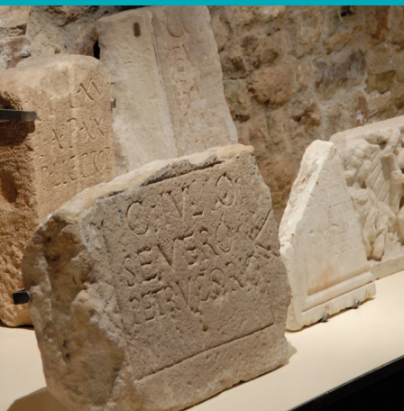
Musée Archéologique

Enfant de - 12 ans, personne handicapée (sur présentation d'un justificatif), guide conférencier agréé par le ministère de la Culture (sur présentation de la carte professionnelle), conservateur du Patrimoine territorial ou de l'État, journaliste (sur présentation de la carte professionnelle), membre de la Société d'Histoire de Fréjus et sa Région, classe dans le cadre de la convention Éducation Artistique et Culturelle et leurs accompagnateurs, et enseignant de Fréjus dans le cadre de la préparation de visites avec validation préalable.