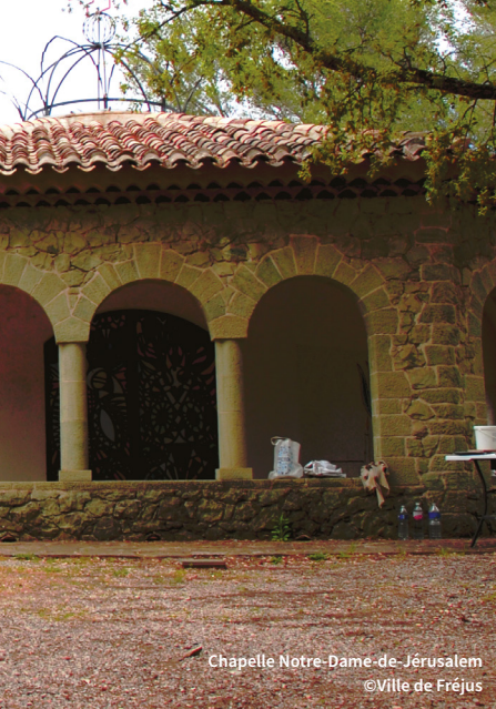
Chapelle Notre-Dame de Jérusalem