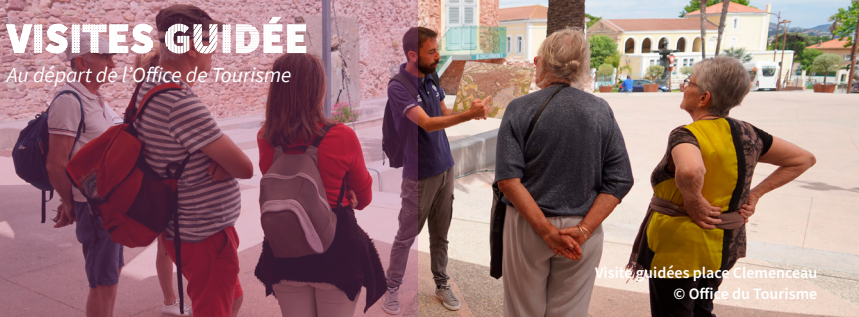
Visite guidées place Clemenceau