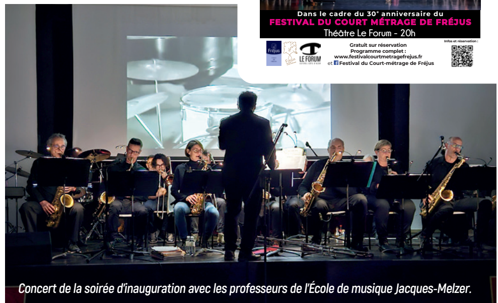
Concert de la soirée d'inauguration avec les professeurs de l'École de musique Jacques-Melzer.